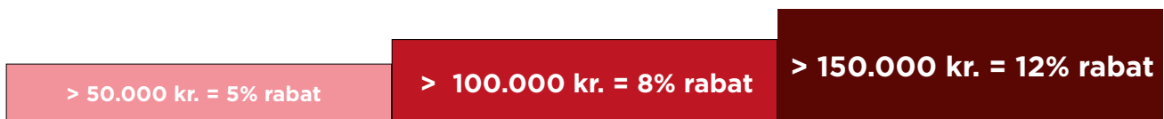
Figur: Oversigt over rabattrin ved aktiveringsrabat

Som noget nyt tilbyder vi dig en aktiveringsrabat, hvis du samtidig med din biografkampagne, booker en sampling eller event. Denne rabat tilbyder vi for at støtte op om at få flere af vores fælles gode og kreative idéer fra tegnebrættet og ud i biografene. Rabatten gives på den aktuelle biografkampagne, der ligger umiddelbart før, samtidig med eller lige i forlængelse af eventen. Du finder rabattrinnene i oversigten herunder.